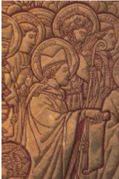
Szent Bonifác - Budapest, Belvárosi Szent Mihály-templom