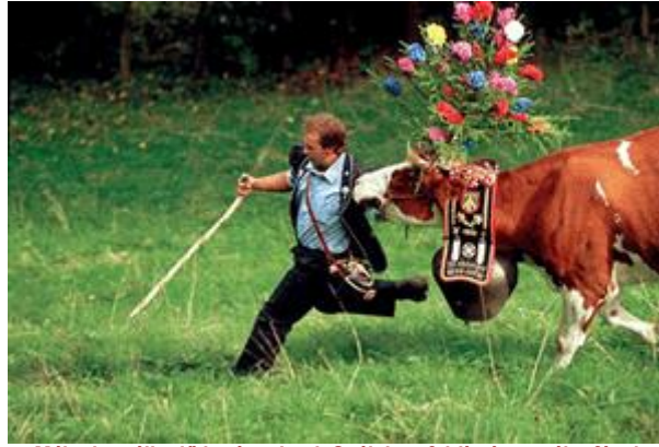
Májusi vetélkedő legényeknek Svájcban feldíszített májusfával

A májusfa állítás története, szimbólumai: